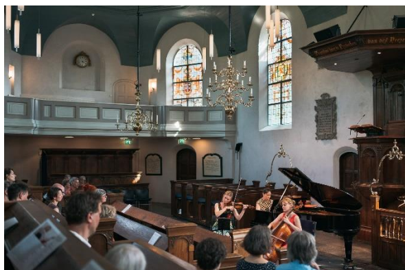
Trioconcert 27 juni Dorpskerk Bloemendaal

In verband met het beperkte aantal toe te laten bezoekers werd het concert van 27 juni twee keer gespeeld.